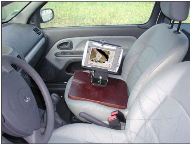
utilisation dans un véhicule